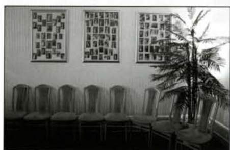
© Volker Wartmann, »Standesamt«, (Original in Farbe)