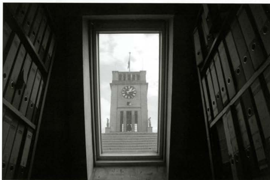
© Volker Wartmann, »Altaktenarchiv«, (Original in Farbe)