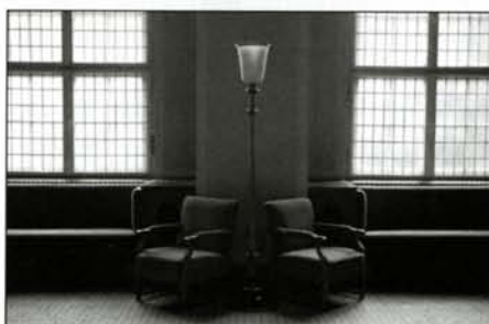
© Volker Wartmann, »Brandenburghalle«, (Original in Farbe)