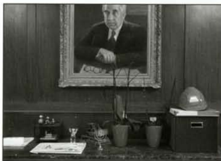
© Volker Wartmann, »Zimmer der Bezirksbürgermeisterin«, (Original in Farbe)

ben. Dank der Unterstützung engagierter Rathaus-Mitarbeiter bekam er auch Zugang zu Räumen, die für die Öffentlichkeit normalerweise absolut tabu sind: beispielsweise zu dem ehemaligen Tresorraum der Stadtkasse Schöneberg, zur Dokumentenkammer im Glockenturm und zur ehemaligen Bierstube des Ratskellers. Mit seinen Fotografien eröffnet Wartmann den Betrachtern eine neue Sichtweise auf das weltbekannte Berliner Wahrzeichen, das im Jahr 2014 sein 100jähriges Bestehen feiert.