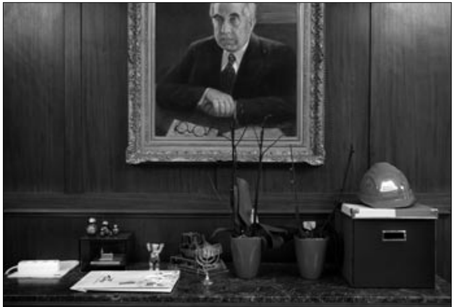
© Volker Wartmann, (Original in Farbe)

Das Rathaus Schöneberg wurde zwischen 1911 und 1914 erbaut. Wartmanns Bilder zeugen von 100 Jahren bewegter Geschichte. Seien Sie herzlich eingeladen zu einer Entdeckungsreise der besonderen Art.